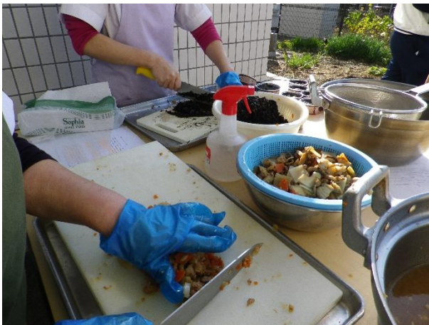
2017年度の炊き出し訓練の様子です

先にはなりますが、9月には炊き出し訓練を実施する予定もあります。先日、こちらにも大きな揺れを感じる地震もありました。災害時の対策として、有効な訓練が出来るようにしたいと思っております。その際には、ご入所様にも、ご不便をおかけすると思いますが、ご協力お願い致します。