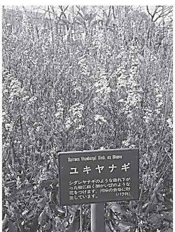
研修先で見かけたゆきやなぎ

要件は何でしょうか。日本の医療費は高齢化により、増加傾向です。二〇二五年には医療費は五十兆超えと言われています。国の医療費の四十六％は高齢者医療費です。その為国は、医療費抑制対策として在院短縮化を図り、在宅療養に力を入れています。それに比例し訪問利用者数も二〇〇一年に三十四万人でしたが十年後には四十一万人と二十％増加しています。利用者の増加に伴い、ステーションも増加しており社会的重要性も上がっているものと思われれます。反面、多くのステーションの経営は厳しく、特に小規模ステーション(常勤換算三人未満)において赤字経営が多いのが現状です。ステーションの三十％強が赤字経営であり、我がステーションも小規模、赤字経営です。設立から今年度で五年の節目を迎える為、視点を変えながら赤字脱却に向けて経営戦略を計っていきたいと思います。市場浸透、開発に対し、富津市を市場とし